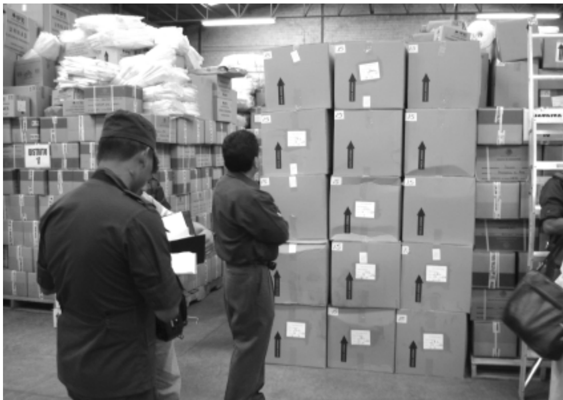
Instituto Electoral del Estado de Jalisco