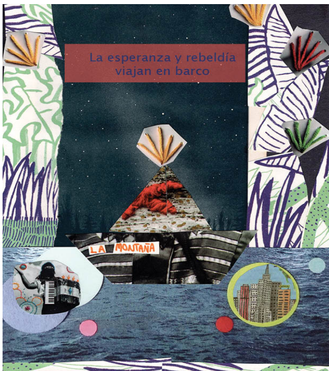
La esperanza y rebeldía viajan en barco. Portada del collage de papel. Autora: Paulina Trejo Méndez, 2021.