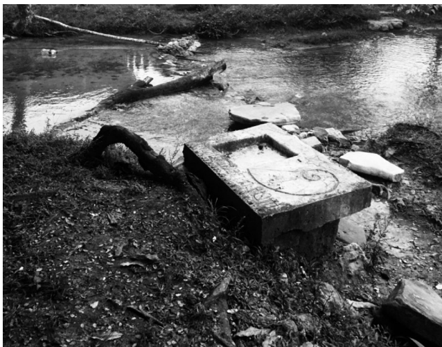
Caracol de La Realidad, Chiapas, 2020.