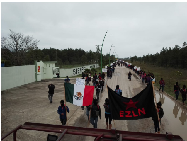
La marcha zapatista pasa por el cuartel en Altamirano, Chiapas.