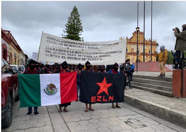
Marcha "Alto a las guerras", San Cristóbal de Las Casas, Chiapas.